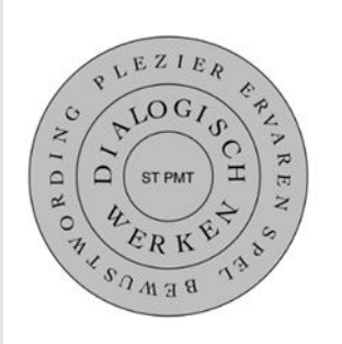
Figuur: De bouwstenen van psychomotore gezinstherapie (PMGT) zijn systeemtherapie (ST) en psychomotore therapie (PMT).