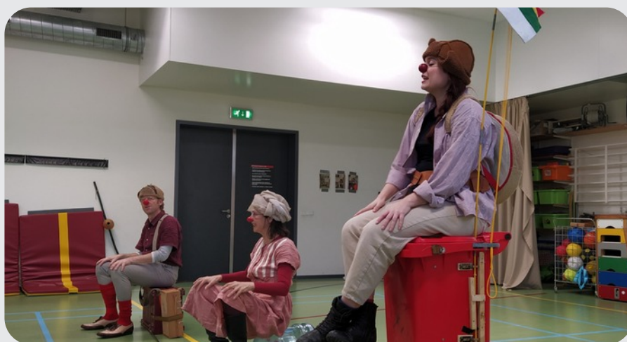
De cliniclowns in actie

De cliënten van het Trefpunt te Groesbeek zijn woensdag 9 maart getraakteerd op een optreden door het Cliniclowns Klein Zintuigen Orkest. Het was bijzonder leuk en verrassend.