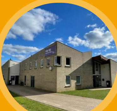
Het V&R gebouw

Er is aan de groepen gevraagd om samen na te denken over een geschikte naam voor het gebouw waarin we samenwerken. Zodra we alles op orde hebben in het gebouw en de naam bedacht is gaan we het gebouw nog officieel en feestelijk openen. Kom gerust alvast een kijkje nemen.